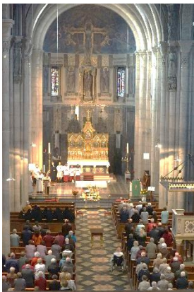
Ökumenische Vesper am 1. Oktober 2017